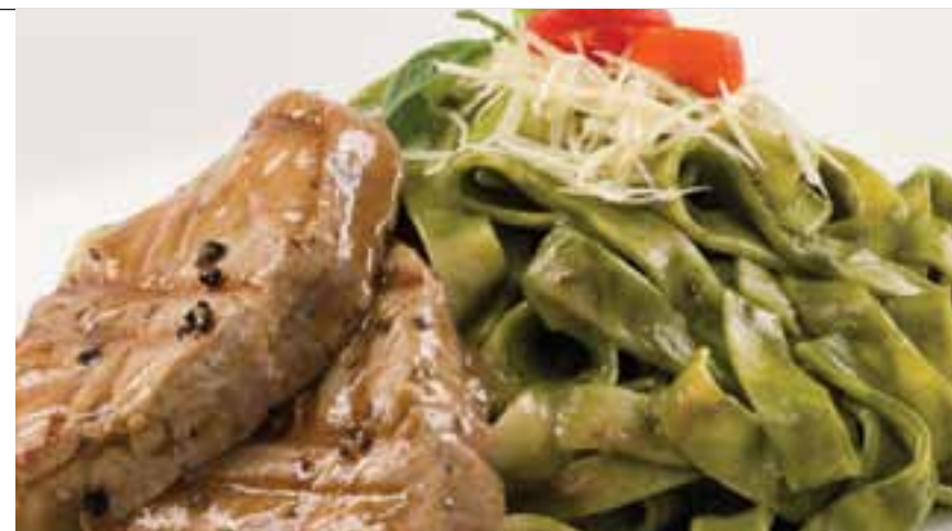
Papardelle al pesto con atún a la pimienta