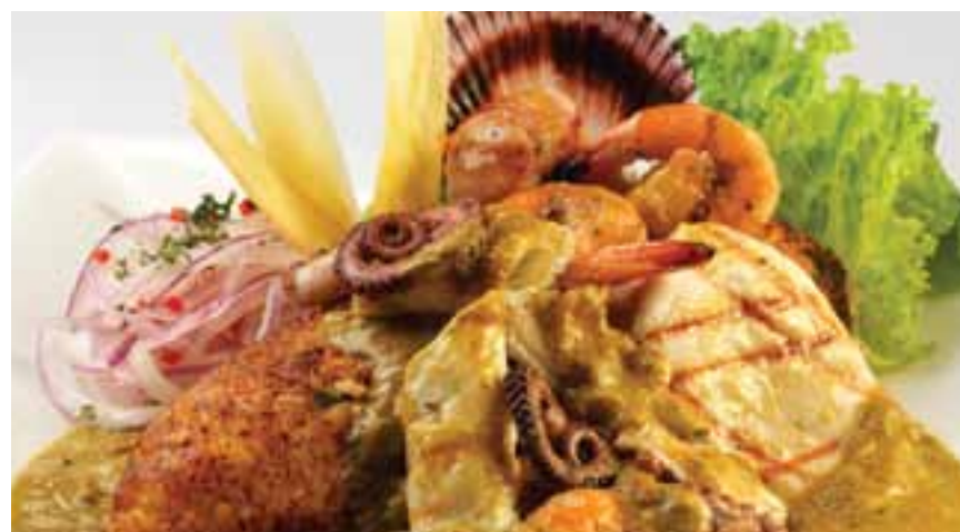
Tacu tacu a la chiclayana