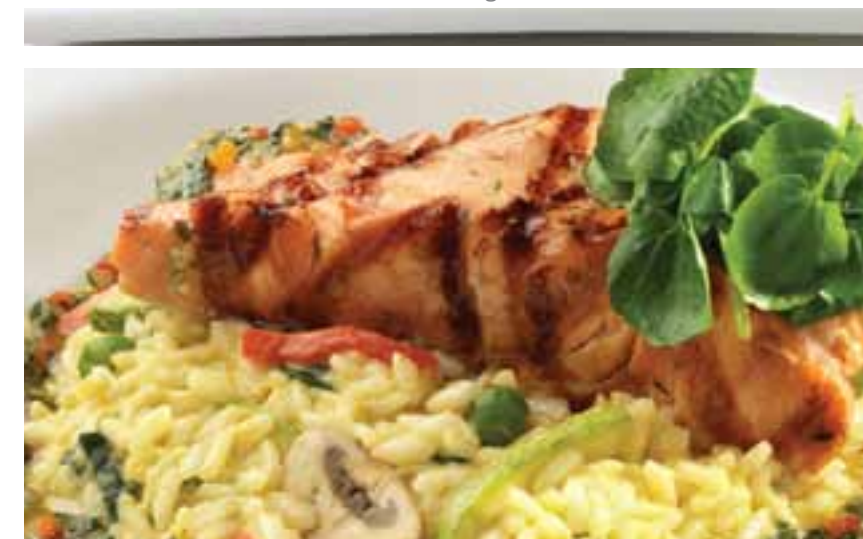
Salmón al fuego con risotto di monti