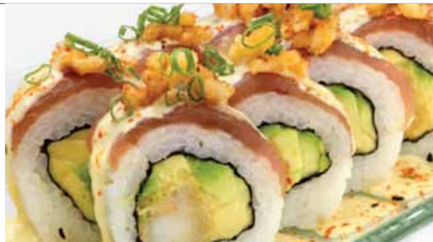
Acebichado new style

Avocado maki € 5.90* / € 10.90** Relleno de atún, queso crema y langostino empanizado, por fuera finas láminas de aguacate bañadas en salsa de anguila y semillas de ajonjolí.