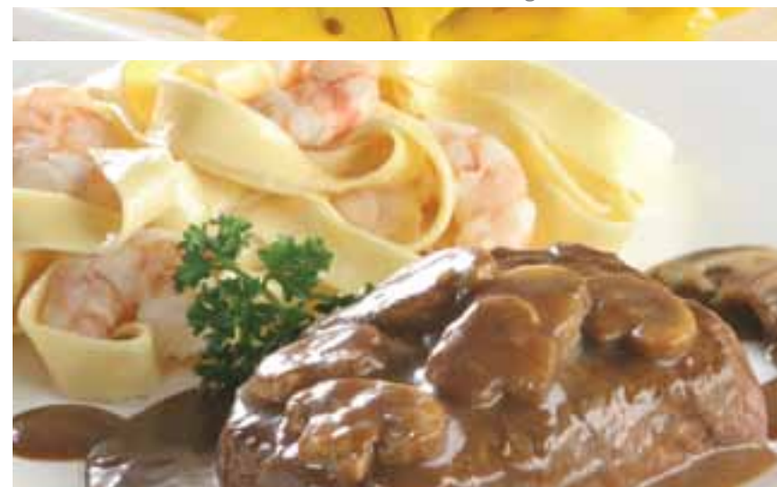
Papardelle lomo mar adentro