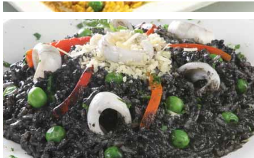
Risotto negro con calamares