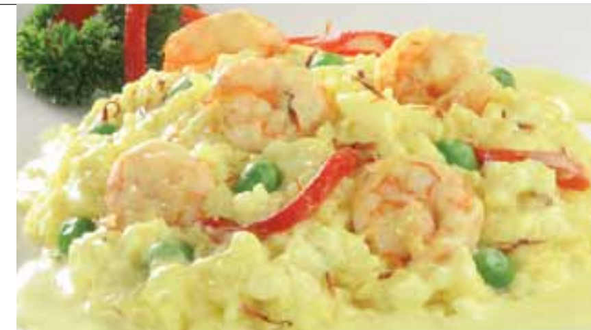
Risotto de langostinos