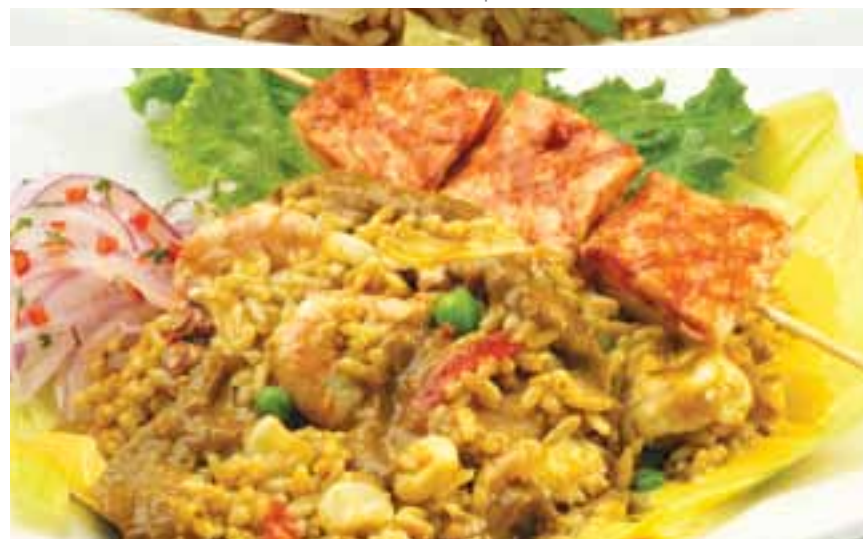
Atamalado de mariscos