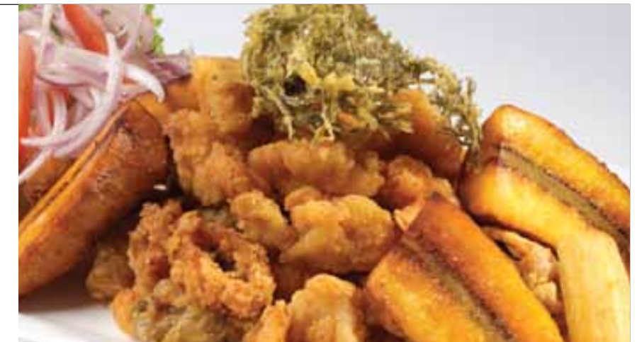
Jalea del pescador