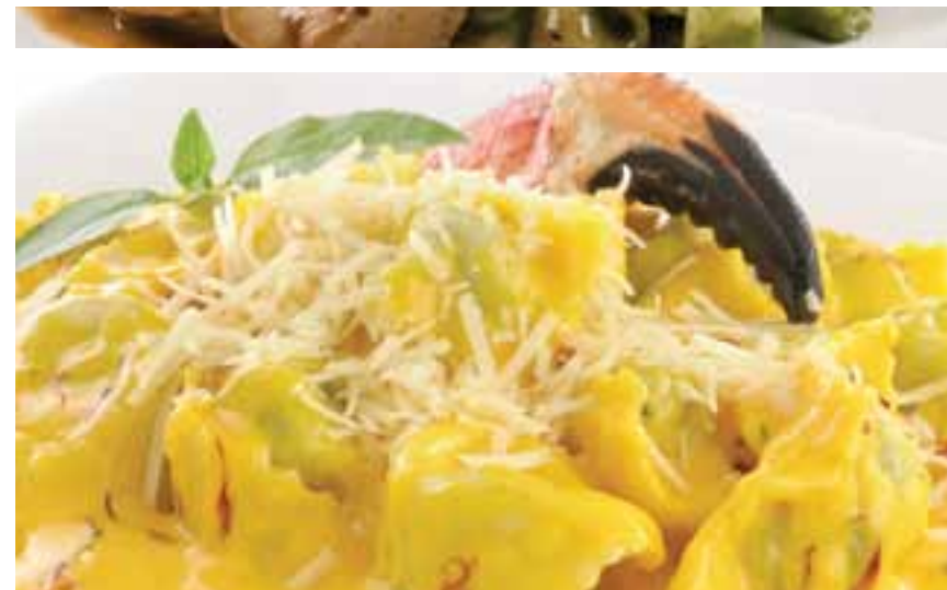
Tortellini de ricotta en salsa de langostinos