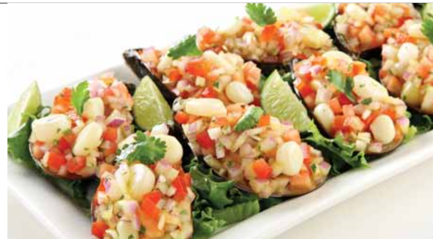
Mejillones a la chalaca