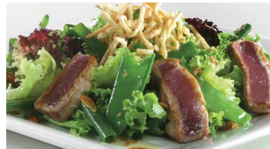
Ensalada de atún oriental