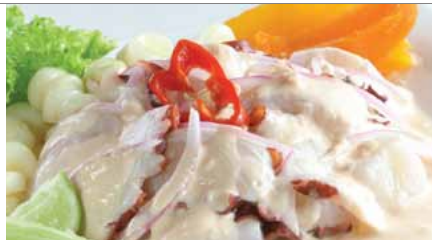
Cebiche Segundo Muelle