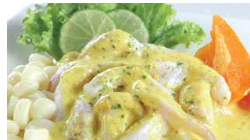
Tiradito a la huancaína