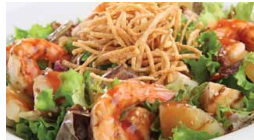
Ensalada de langostinos a la BBQ