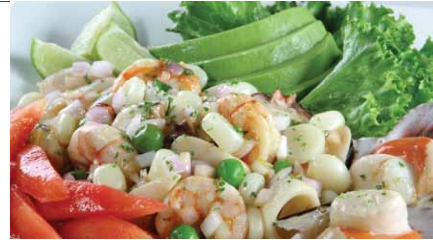
Ensalada de mariscos