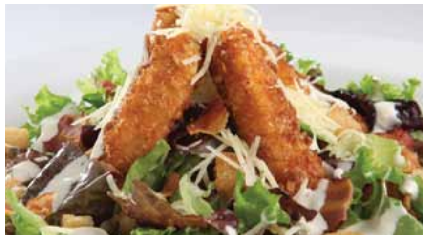
Ensalada Caesar's con pollo crocante