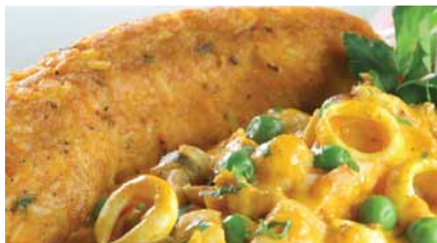
Tacu tacu con picante de mariscos