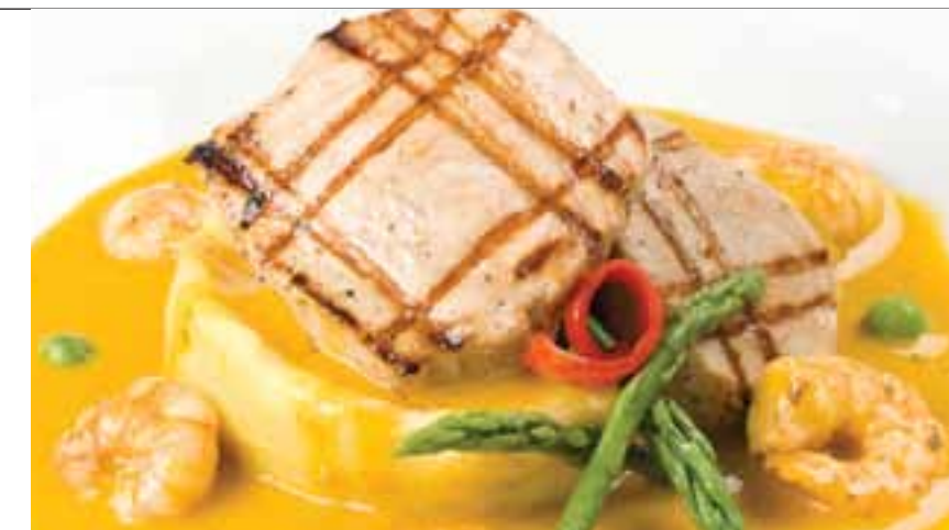
Pez espada con salsa de chupe