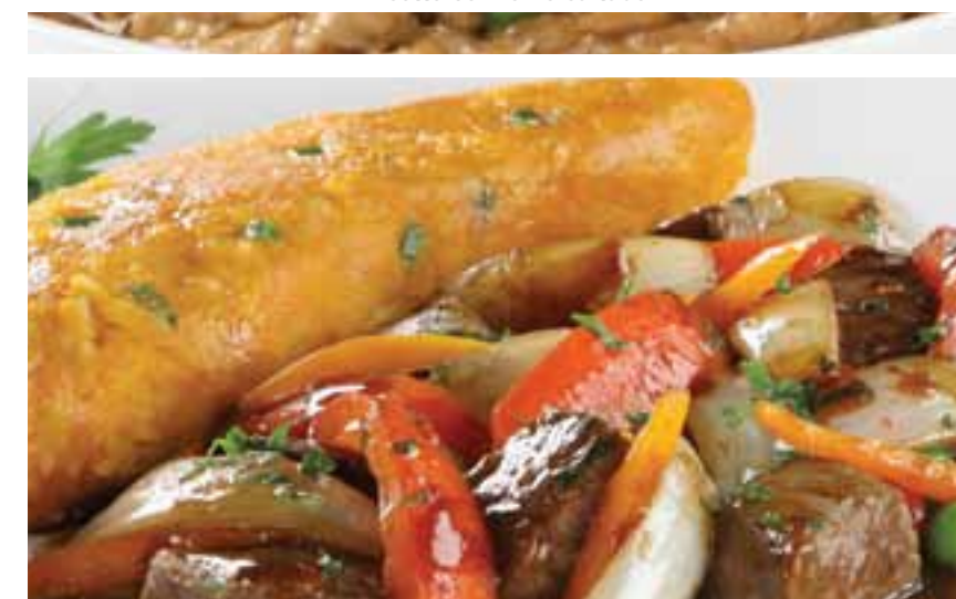
Tacu tacu con lomo saltado