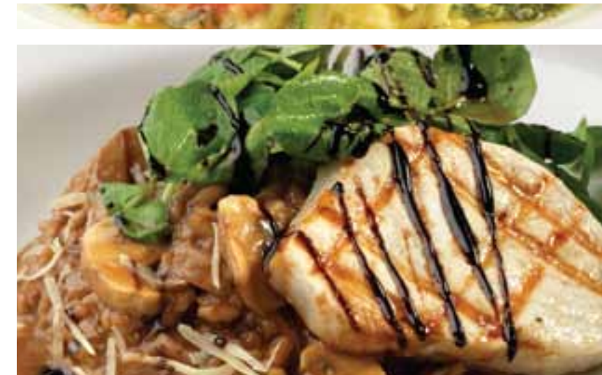
Risotto de hongos con pez espada a la parrilla