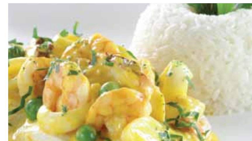
Pescado a lo macho