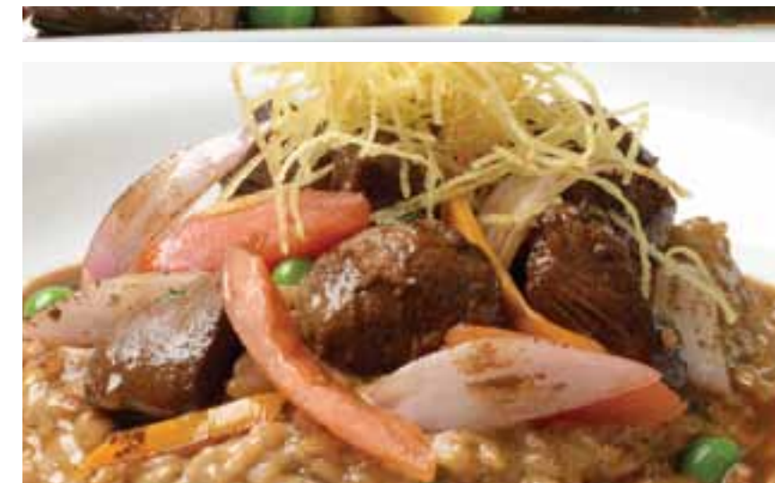
Risotto con lomo saltado