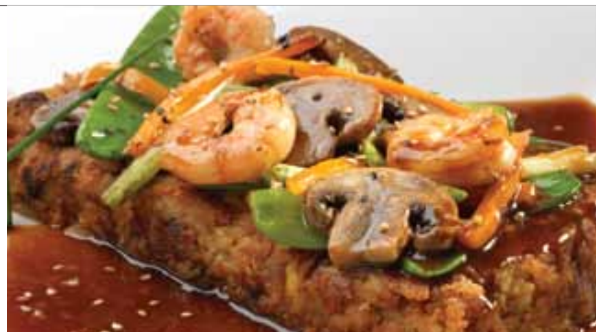
Tacu tacu chifero