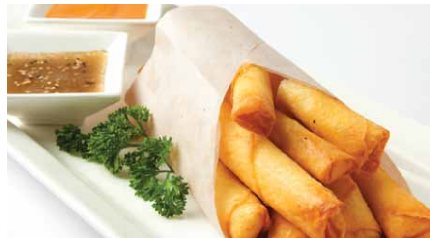
Spring rolls de ají de gallina