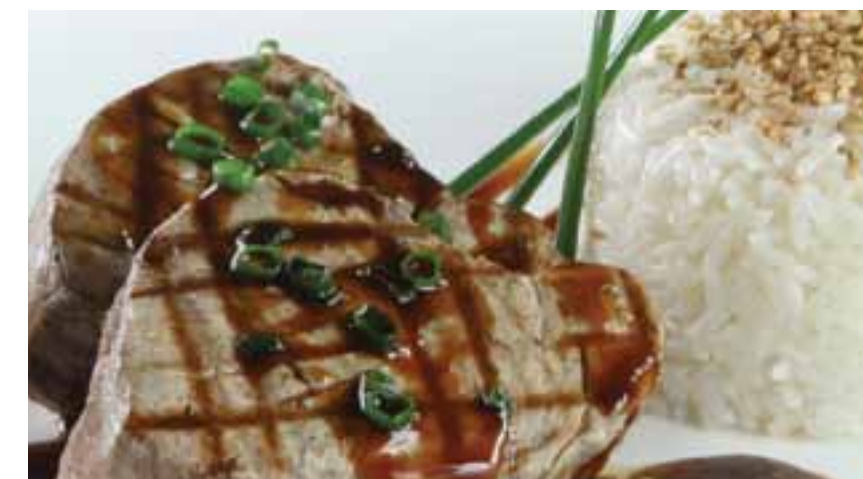
Atún a la parrilla en salsa teriyaki